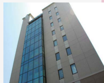
旭総合研究棟 正門から150mほど直進 した正面9階建て建物。