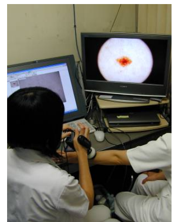
ダーモスコーピー

専門研修では少なくとも年間20~30例の手術経験が可能です。悪性腫瘍以外にも当科には長野県内の重症例、難治例の多くが集まってくるので、総合的な研修が可能です。