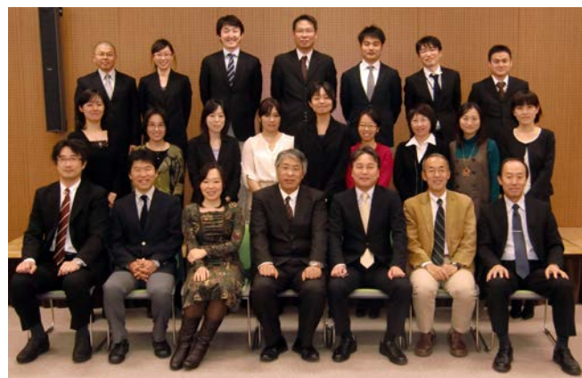
医局員一同 日本皮膚科学会信州地方会にて

また4年目以降で他院からの移動も可能です。その場合は経験等により、個別プログラムを検討します。