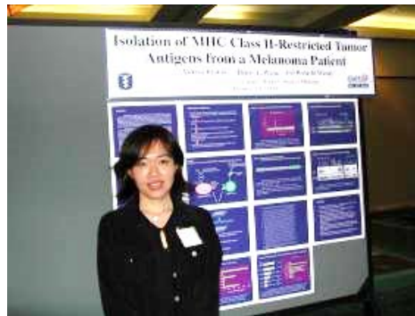
留学先での学会発表

post doctoral associate(有給) メラノーマの免疫応答の解析