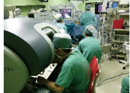
Da Vinci 手術