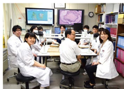
毎朝の病理診断科症例検討会の光景

研究分野では消化管病理の研究を始め、様々な分野での臨床医とのコラボレーションが行われています。また当科ならび検査部門には40名以上の臨床検査技師がおり、様々な技術や知見を有しています。彼らとの共同研究も盛んに行われています。大学院進学は随時可能です。