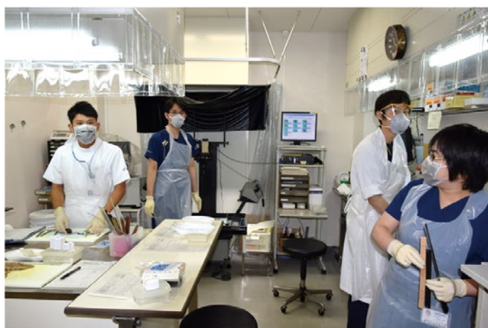
後期レジデントによる手術材料の切り出し風景