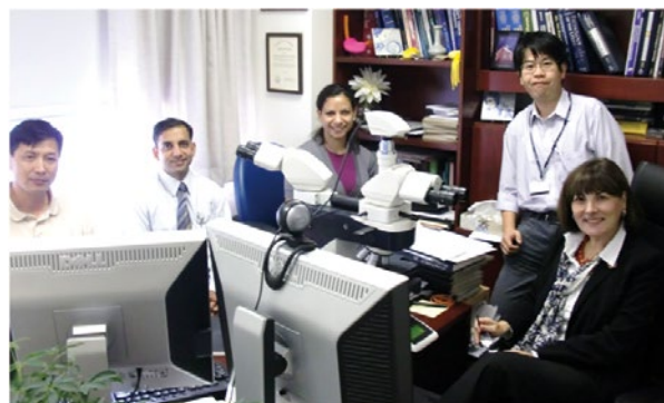
ペンシルバニア大学と研究室風景