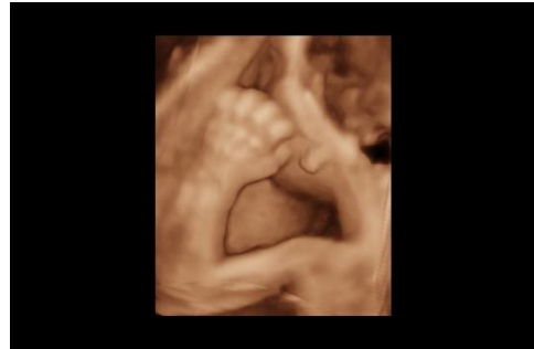
（恥ずかしがり屋さんかな？お顔を見せてくれません。）