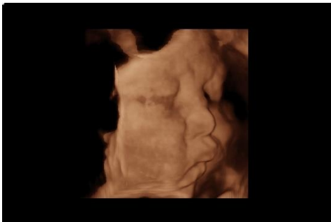
（赤ちゃんのお顔が映ります）

カラー写真をプリントアウト（サイズ 144×100 mm）して、原則3枚をお渡しいたします。（なお、DVD、CD 等による画像の提供及び録画は行っておりません。また、当日のビデオ撮影はご遠慮ください。）