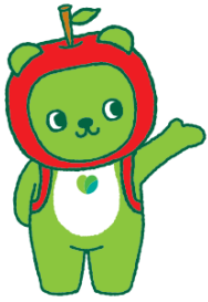
長野県PRキャラクター『アルマ』 ©長野県アルマ