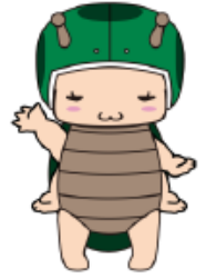
信州大学附属図書館マスコットキャラクター 『信大ナナちゃん』