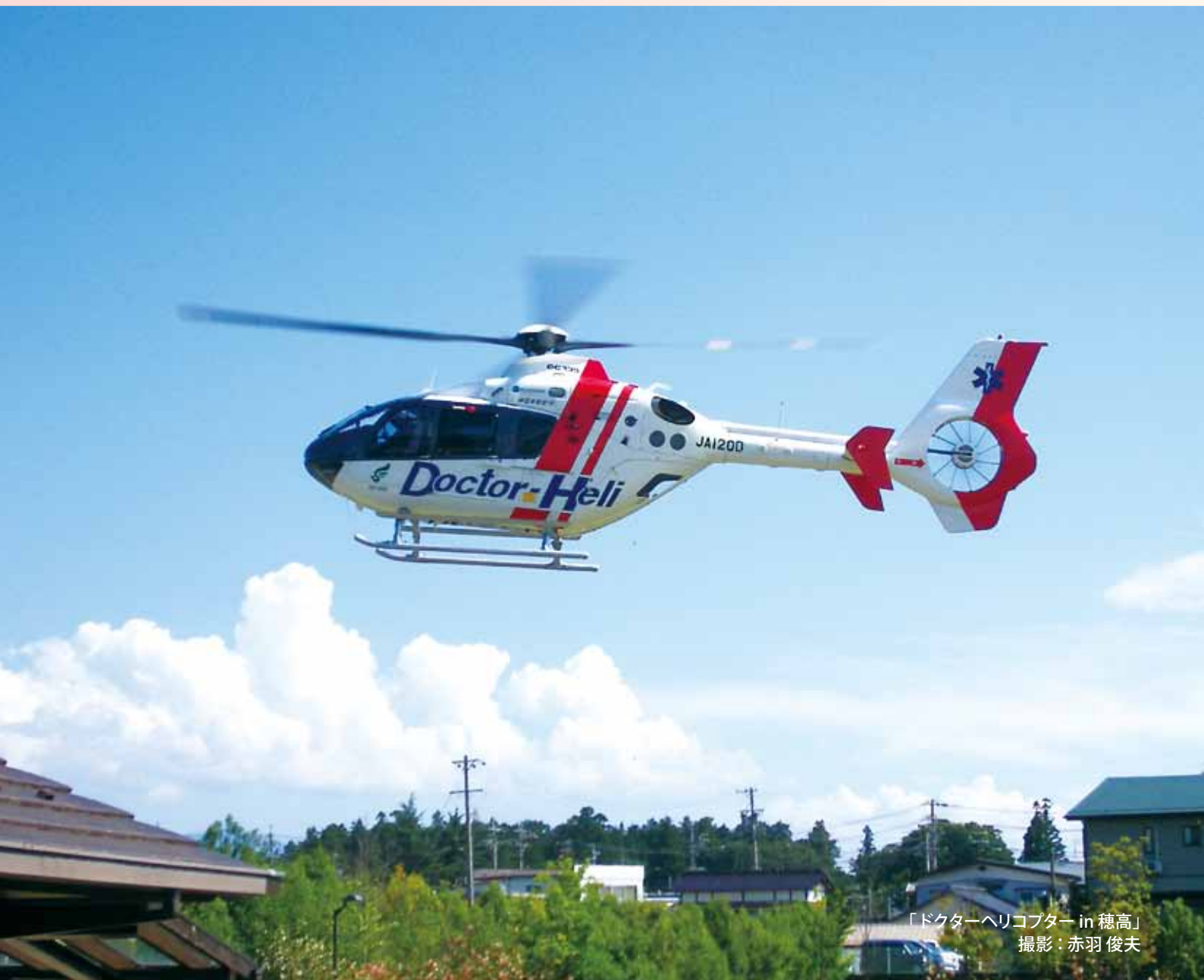
「ドクターヘリコプター in 穂高」

本院は診療・教育・研究を遂行する大学病院としての使命を有し、また患者さんの人権を尊重した先進的医療を行うとともに、次代を担う国際的な医療人を育成する。