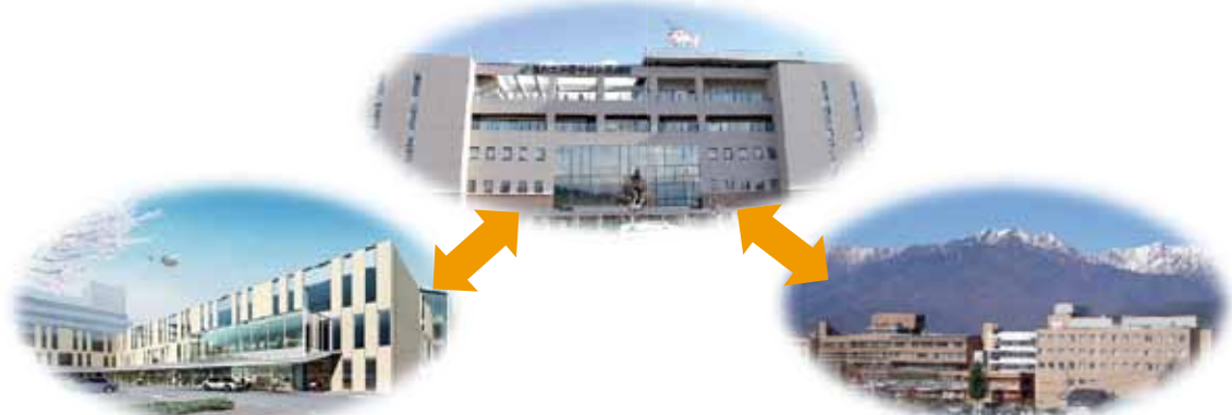
救急総診外来研修の中核となるJA厚生連 北信総合病院